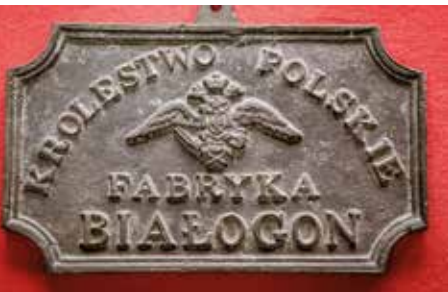
Tablica okolicznościowa, Białogon, okres Królestwa Polskiego

Obie huty nieprzerwanie podtrzymują i rozwijają tradycje przemysłowe regionu, na obszarze którego funkcjonował najstarszy w Polsce, Staropol-ski Okręg Przemysłowy.