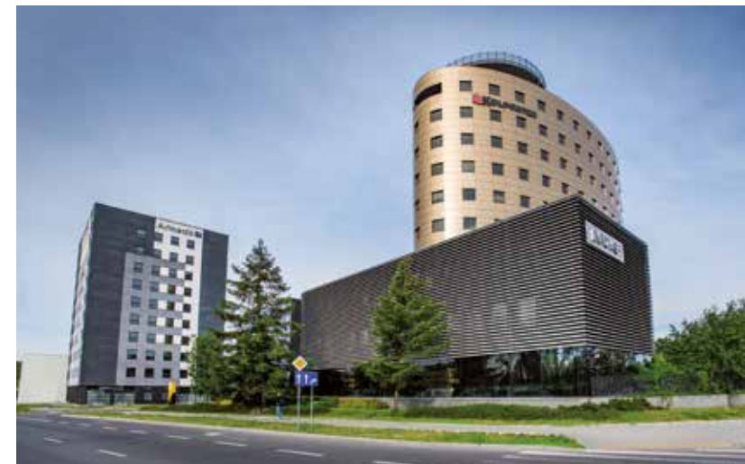
Kompleks biurowców firm Kolporter i Infover