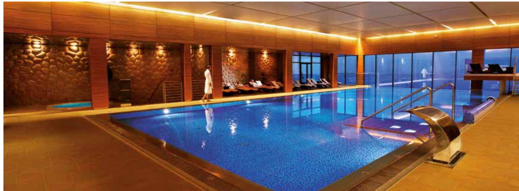
5-gwiazdkowy hotel Odyssey

skategoryzowanych ośrodków wypoczynkowych, pensjonatów, zajazdów, obiektów agroturystycznych i pięknie położonych centrów edukacyjnych. Oferta wielu z nich obejmuje nie tylko organizację spotkań biznesowych w doskonale wyposażonych strefach konferencyjnych, ale także relaks w centrach wellness i spa, aktywny wypoczynek dla entuzjastów sportu, oferując korty, baseny oraz raj dla podniebienia podczas bankietów, przyjęć czy kameralnych kolacji.