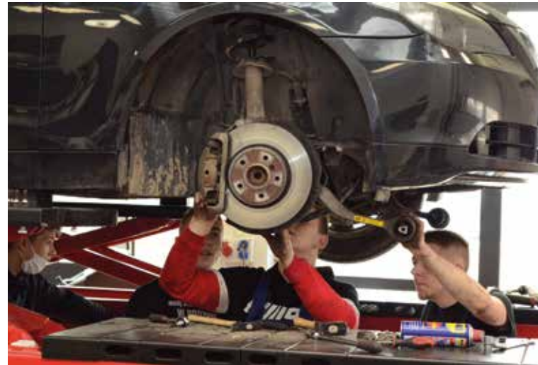
W inicjatywy #Kielcedlaprzedsiębiorców angażuje się m.in. CK Technik

„Talent Office”, a więc usług miejskich z zakresu obsługi rynku pracy. W ramach pilotażu powstało Centrum Wspierania Kariery z siedzibą w Kieleckim Parku Technologicznym, z którego pomocy i doradztwa korzystają zarówno przedsiębiorcy, jak i osoby bezrobotne.