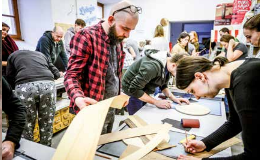
Konkurs Off Fashion przyciąga do Kielc projektantów i entuzjastów mody