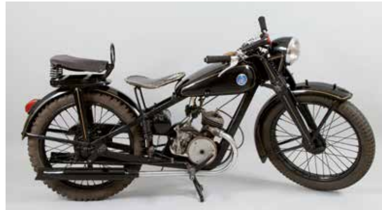
Motocykl SHL 98, Huta Ludwików, 1939 r.