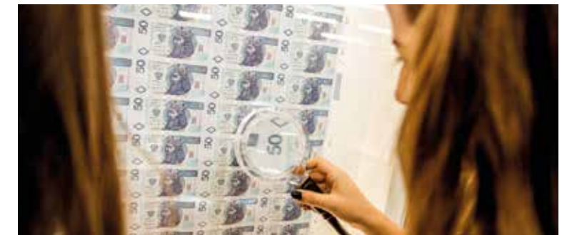
Ponad 150 uczniów wzięło udział w projekcie „Program: Edukacja Przedsiębiorczości”