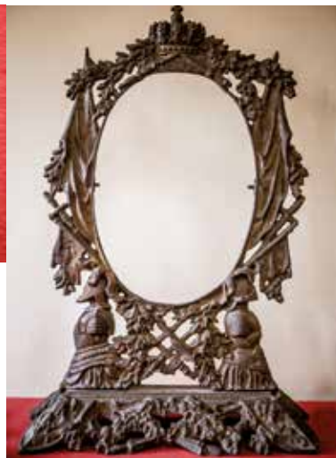
Oprawa lustra, Białogon, II połowa XIX w.