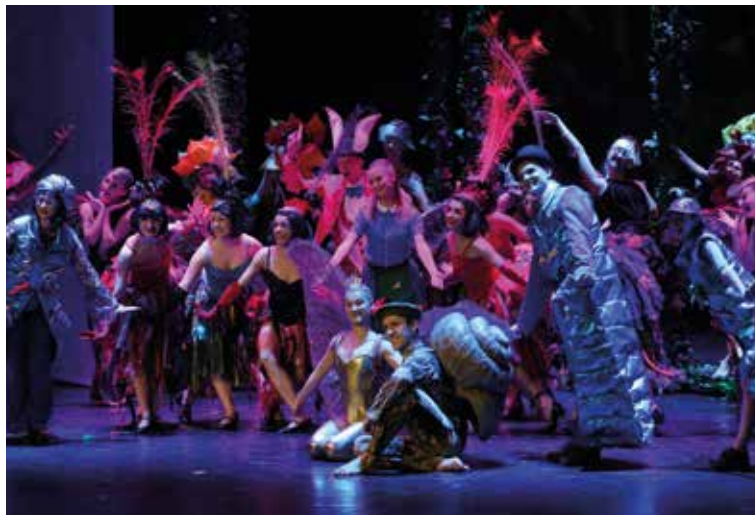
Kielecki Teatr Tańca podczas gali jubileuszowej Targów Kielce