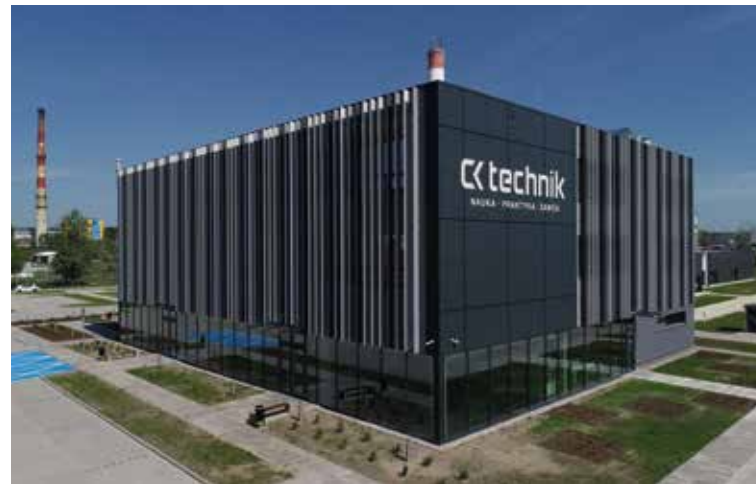
Centrum Kształcenia Zawodowego i Ustawicznego CK Technik