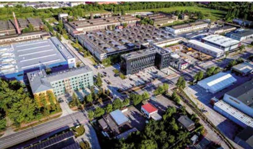
Zespół Inkubatorów Technologicznych KPT

Co ważne, przedsiębiorcy zyskują możliwość uczestnictwa w praktycznym kształceniu młodych fachowców, którzy w przyszłości mogą zasilić kadry danej firmy. Z CK Technik współpracują m.in. Aebi Schmidt Polska, BMW Group Polska, KH-KIPPER czy NSK Bearings Polska.